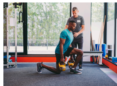
目的に合わせたトレーニング